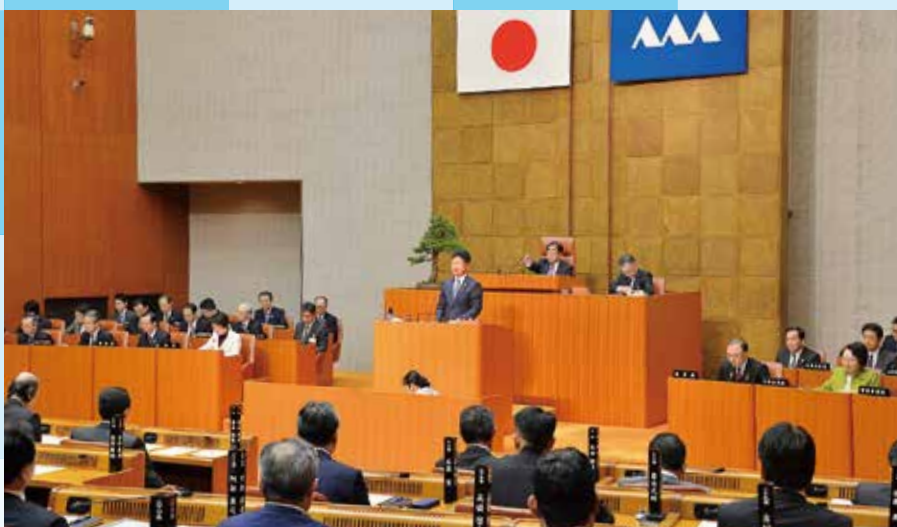
自民党会派を代表して初めて代表質問に立ちました(平成29年12月定例会)