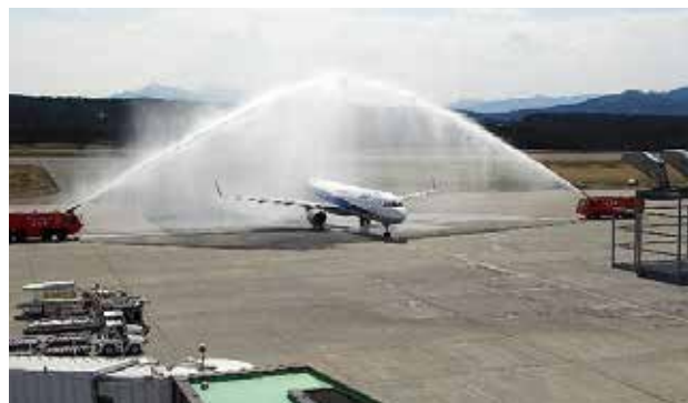
平成 29 年 3 月から新型機 A321neo が就航

RESA（滑走路端安全区域）の必要な長さが、旧基準40mから新基準90mに改定されたため、庄内空港、山形空港とも基準不足となった。RESA基準不足への対応と、滑走路延伸等による機能強化についてどう考えているか。