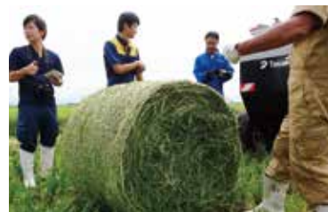
西郷北部地区で 取り組んでいる 飼料用米生産▶

担い手への農地集積を進めるためには、生産効率の高い優良な農地の整備を進める必要があるが、要望に十分応えきれていない。県の掲げる水田の大区画化と畑地化に係る整備面積の目標と、その達成に向けた予算の確保のためどう取り組んでいくのか。