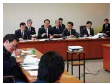
福岡県の 適正利用への 取り組みを調査▶

スマホやタブレットの普及により、児童生徒のネット依存、ネット内でのいじめが問題となっている。不適切な使用を防ぐには生徒の自主的な取り組みを促す、また教員や保護者がネットを理解し、適切に関わることが肝要である。本県の取り組みの現状と課題をどのようにとらえているか。